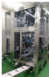
Tパウチ・ショット 充填機