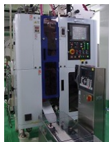
三方シール 充填機